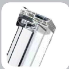
PTP U3, PTP/GO U3